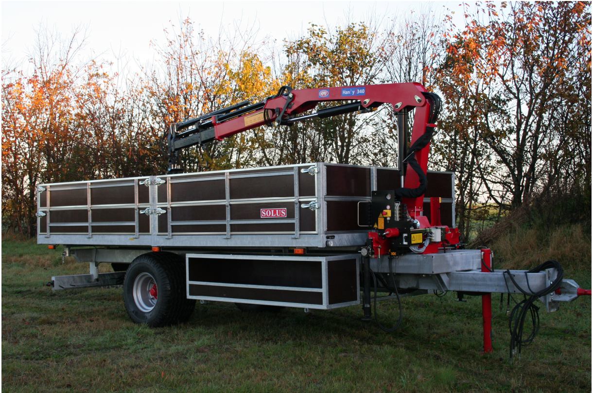
Tipvogn med kran